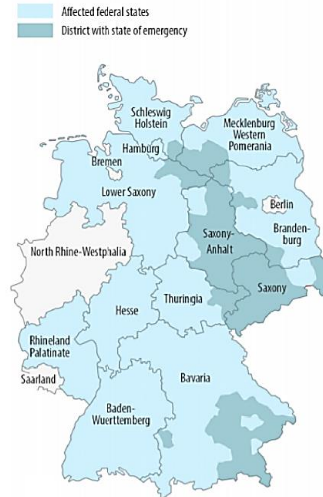
Fig. 1. Flood affected federal states and districts that declared state of emergency during the 2013 flood disaster in Germany (from: Thielen et al., 2016).